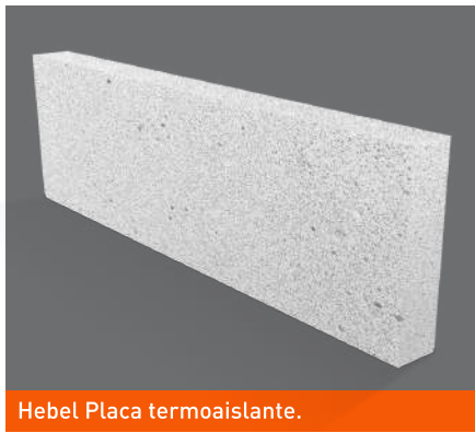
Hebel Placa termoaislante.